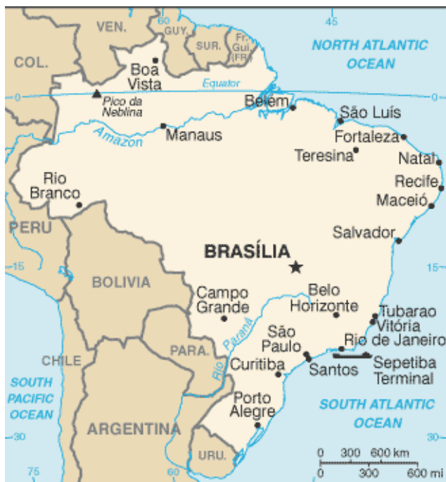
Imagen 1: Localización geográfica de Brasil

Brasil es un país situado al este en América del Sur, en el océano Atlántico. Es el quinto país más grande y poblado del mundo con una extensión total de 8,514,877 kilómetros cuadrados y una población que asciende a 201 millones de habitantes 1 . El vasto territorio y el número de habitantes de Brasil lo convierten en un país con una gran reserva de recursos naturales y numerosa fuerza laboral. Las ciudades más importantes son Sao Paulo (20 millones de habitantes), Rio de Janeiro (12 millones), Belo Horizonte (6 millones), Porto Alegre (4 millones) y la capital Brasilia (4 millones).